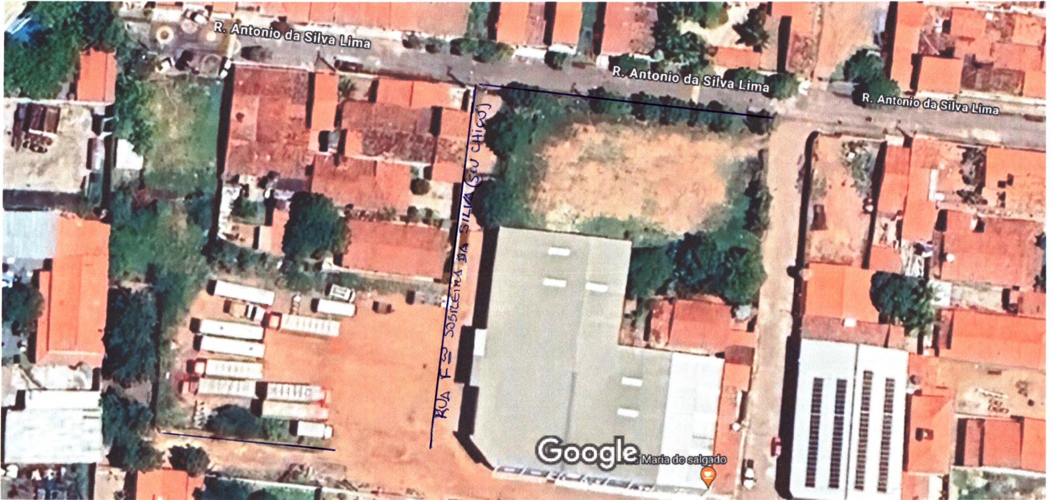
Imagens ©2024 Airbus, Dados do mapa ©2024 10 m